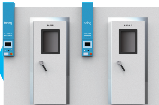
步入式药品稳定性试验箱（两箱）